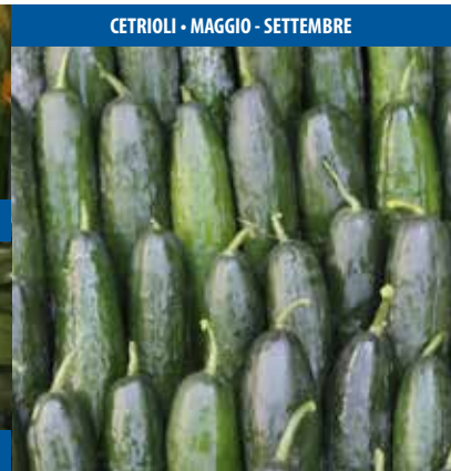
CETRIOLI - MAGGIO - SETTEMBRE