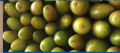
POMODORO OBLUNGO - GIUGNO - OTTOBRE