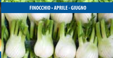
FINOCCHIO - APRILE - GIUGNO