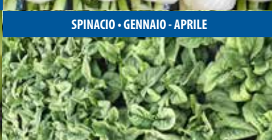
SPINACIO - GENNAIO - APRILE