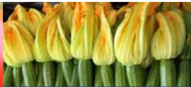
ZUCCHINE CON FIORE - MARZO - NOVEMBRE