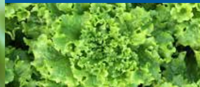
LATTUGA GENTILE - OTTOBRE - APRILE