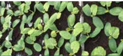
VIVAIO DI 5.600 MQ