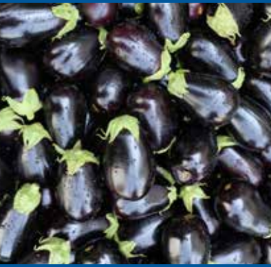
MELANZANA TONDA GLOBOSA - MAGGIO - SETTEMBRE