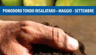
POMODORO TONDO INSALATARO - MAGGIO - SETTEMBRE