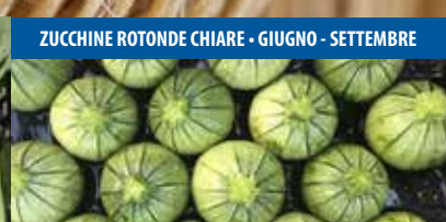
ZUCCHINE ROTONDE CHIARE - GIUGNO - SETTEMBRE