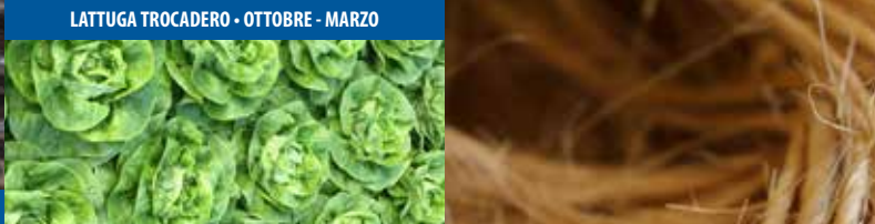
LATTUGA TROCADERO - OTTOBRE - MARZO