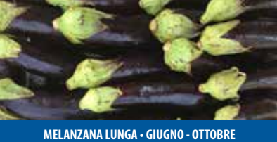
MELANZANA LUNGA - GIUGNO - OTTOBRE