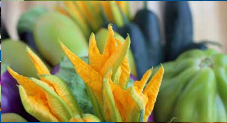
ZUCCHINE SCURE - MAGGIO - OTTOBRE