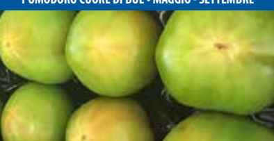
POMODORO CUORE DI BUE - MAGGIO - SETTEMBRE