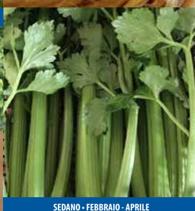
SEDANO - FEBBRAIO - APRILE